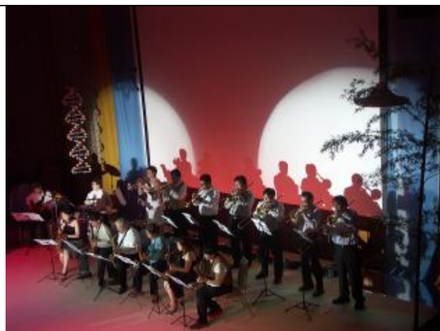
Un vrai Big Band!!!