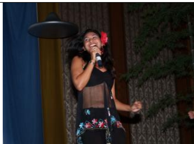
Une nouvelle participante tres dynamique, de Thaïlande