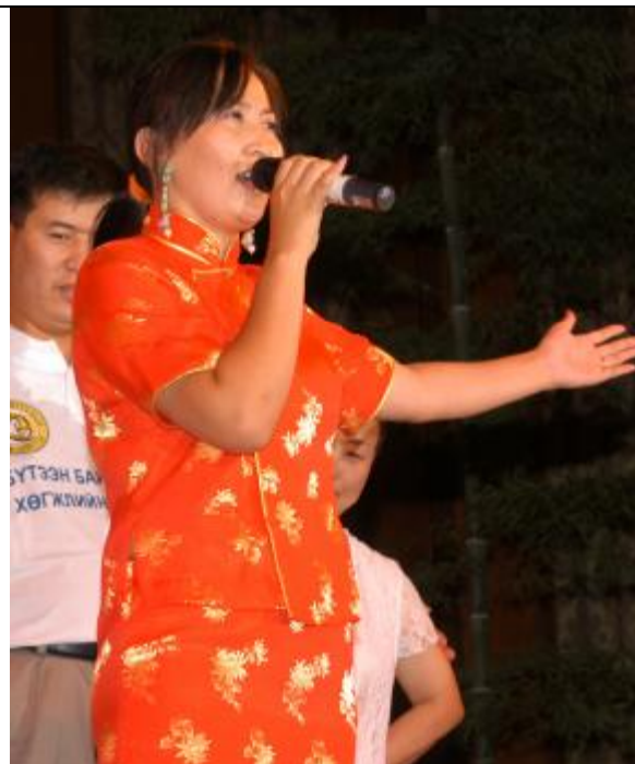
La nouvelle responsable pour la Mongolie, et une première pour le Mouvement, puisqu'elle est... journaliste !!!

Un peu plus bas, quelques images de cette semaine spéciale, et bien sûr, des superbes spectacles présentés presque tous les soirs... Félicitations à tous, et un merci particulier au guide continental Junzo qui a dirigé cette semaine de stage si discrètement et si efficacement... J