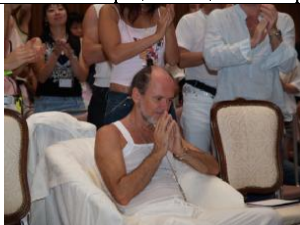
Merci Prophete Bien Aime, Merci ELOHIM....

En ce qui a trait aux nominations, les nouveaux responsables nationaux dont nous avons publié la liste dans un numéro précédent, ont été confirmés le dernier jour du stage.