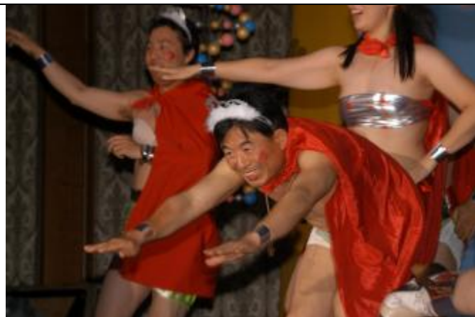
Cosmos, le guide national Coréen, dirigeant son équipe de guides dans une drôle de danse, s'amusant tout autant que dans sa vie courante avec sa danse spéciale avec le gouvernement Coréen, essayant de permettre l'accès au pays pour le Maitreya RAEL