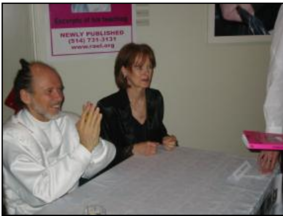
Durante la firma del libro con Nicole

Siamo talmente felici di "fare casino" insieme. E' ciò che fa che siamo totalmente indistruttibili. Spero che vi piaccia questa campagna di infiltrazione. Potremo proporre loro di essere non identificati proprio come gli UFO... UGO: Unità Giornalistiche Ottuse. Poiché quando ci si infiltra questo ci piace e abbiamo la voglia di ricominciare J