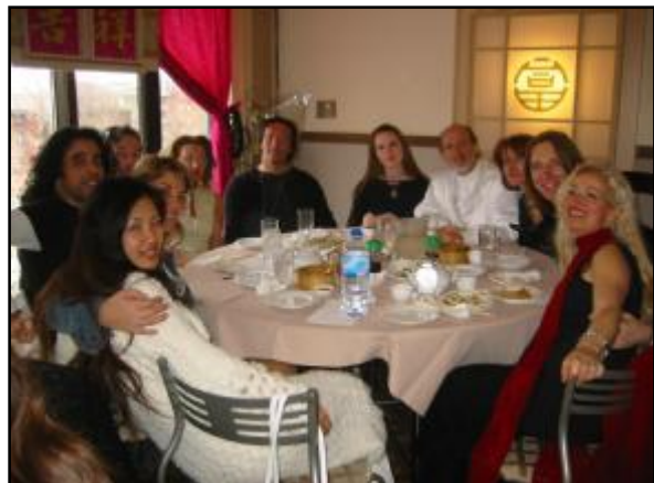
Durante la cena che è seguita al ristorante cinese...