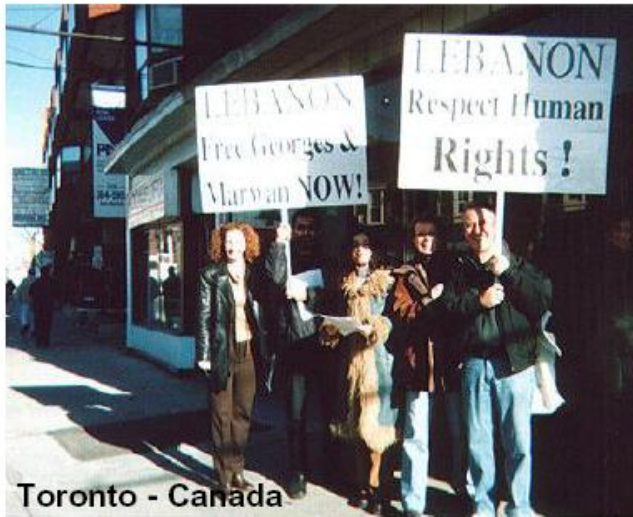
Toronto - Canada