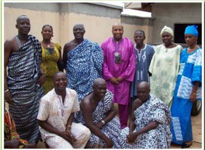
Kumasi: Avec le pere de l'empereur Ashanti Emperor, Nanan Owouso and le Roi des Abrons ainsi qu'une Princesse Abron