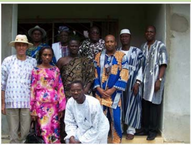
Conseil superieur avec Sa Majeste Nanan TEHOUA II, Roi de ARRAH