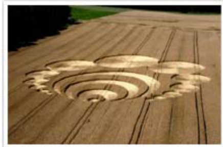
Vaud County, July 61 aH