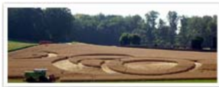
Neuchatel, Aug 6th 62 aH