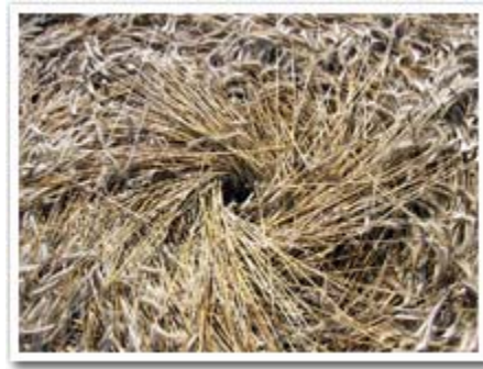
Not easy to reproduce with a board!