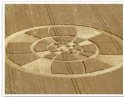
Dommartin, July 61 aH