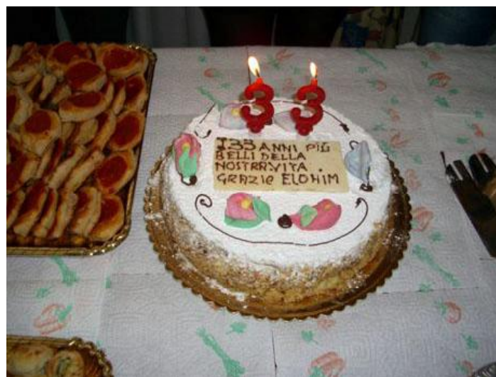
No comments ;-)