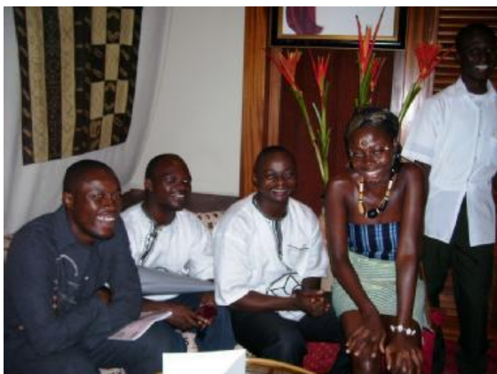
L'équipe d'organiseurs ...