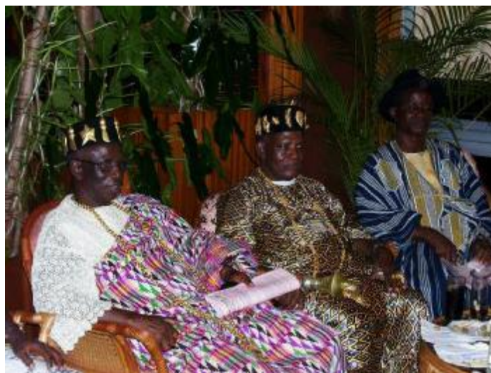
Quelques uns des chefs traditionnels venus rencontrer notre Prophète Bien Aimé virtuellement.