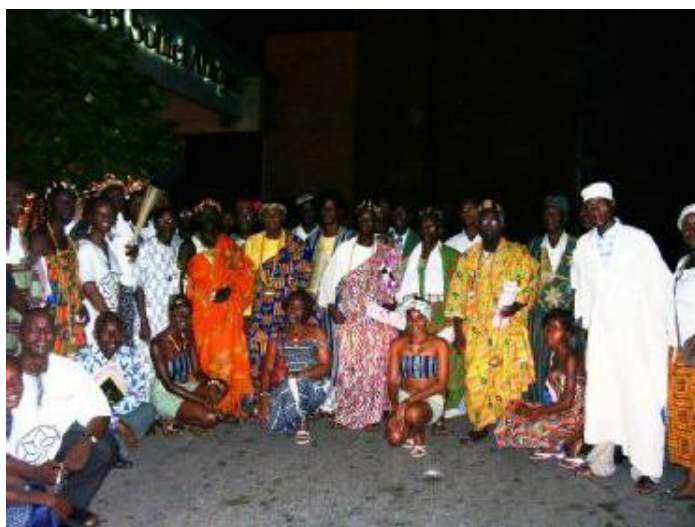
Fete coloree en soiree !!

Un représentant des chefs coutumiers de Côte D'Ivoire a lu cette déclaration à notre Prophète Bien Aimé après son discours du 20 décembre.