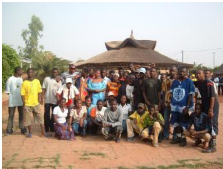
Les 69 nouveaux raeliens