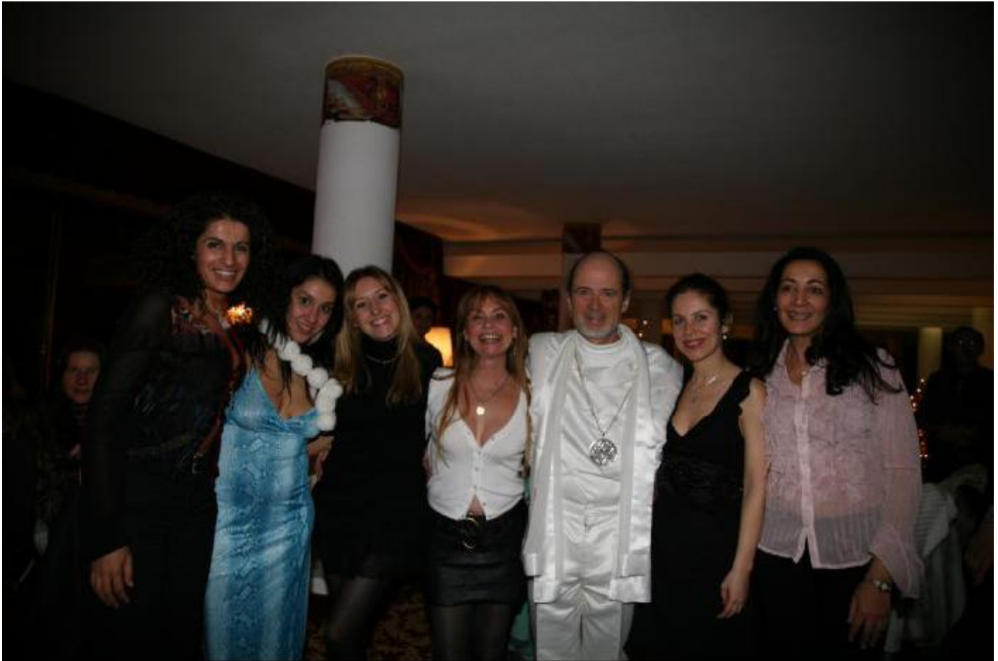
Notre Prophete Bien Aime, bien entoure lors de la fete du 13 decembre J

Apres les transmissions, il nous a parlé d'humour.